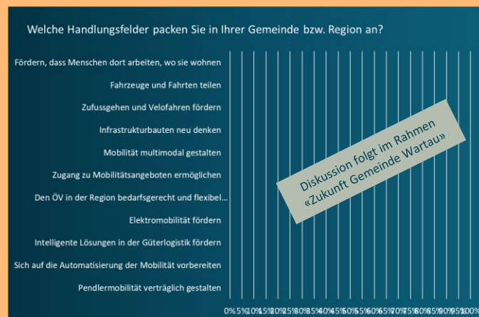
Abbildungen: Stimmungsbilder aus dem Workshop RegioMove START vom 30.1.2019 mit 180 Personen

Wir wollen unsere Mobilitätszukunft aktiv angehen. Mit RegioMove START haben wir erkannt, dass wir es selber in der Hand haben und jede und jeder einen Beitrag leisten kann. Wir haben Lust auf die Zukunft!